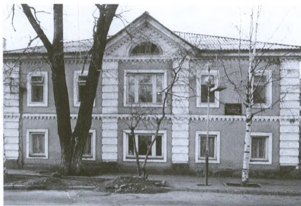
Подворье Ульяновского Троице-Стефановского монастыря. Снимок 1988 г. Управление Сыктывкарской и Воркутинской епархии

не только от горожан. Но полностью работы по благоустройству храма так и не были закончены, хотя он и был действующим [19].