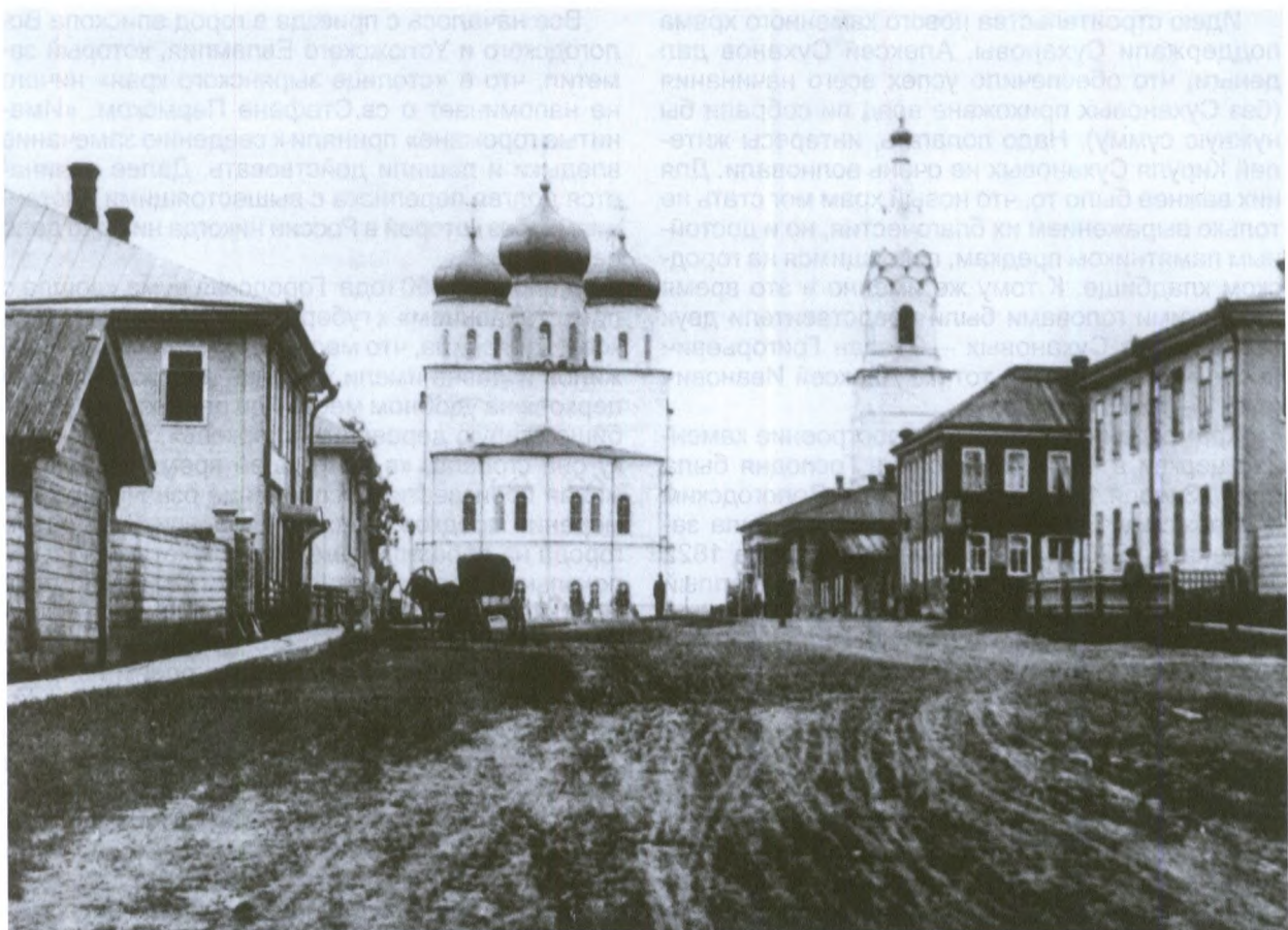
Стефановская площадь со стороны Трехсвятительской улицы

разрешить построить новую церковь «посреди города на площади» (под прошением подписались практически все городские семьи).