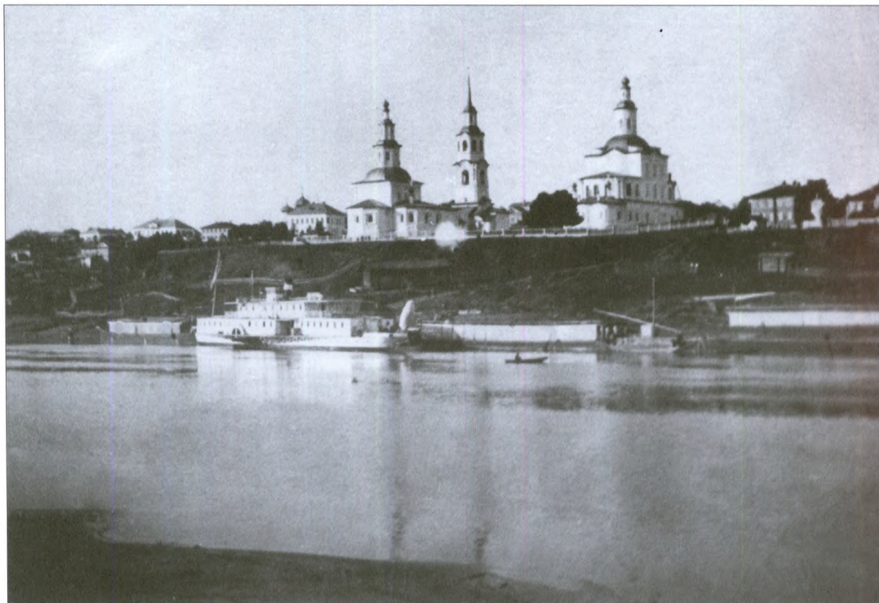
Троицкий собор со стороны р. Сысолы

ка Георгия Стратотерпца об одном же престоле, своим иждивением и без остановки».