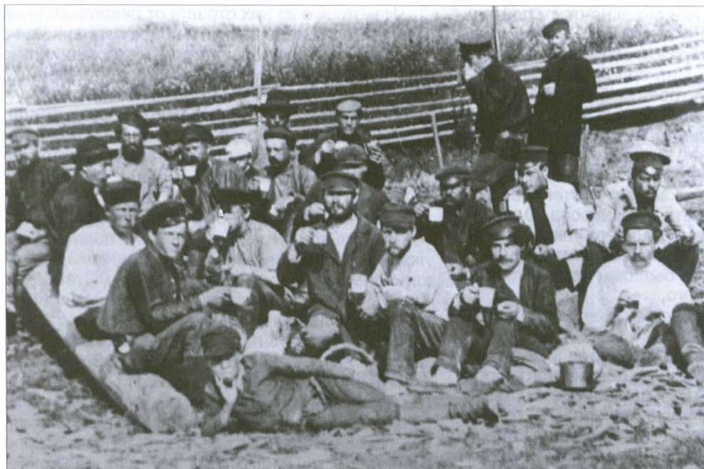
Политссыльные на строительстве Вильгортского тракта. 1910 г.

полицейский надзиратель обязаны были следить за каждым шагом своих «подопечных», у которых при приезде отбирались документы и взамен выдавался временный вид на жительство. Ссылные должны были регулярно являться в полицию на отметку. Полиция имела право в любое время суток входить в квартиру ссыльного, производить обыски и досмотры. Но она же отвечала и за выплату ссыльным пособия (находившиеся под надзором полиции могли работать, но были существенно ограничены в выборе поля деятельности – они не могли состоять на государственной или общественной службе, заниматься преподаванием, читать публичные лекции, учреждать частные общества и компании и т.д.). Понятно, что полиция и ссыльные не питали нежных чувств друг к другу, что довольно часто порождало конфликтные ситуации.