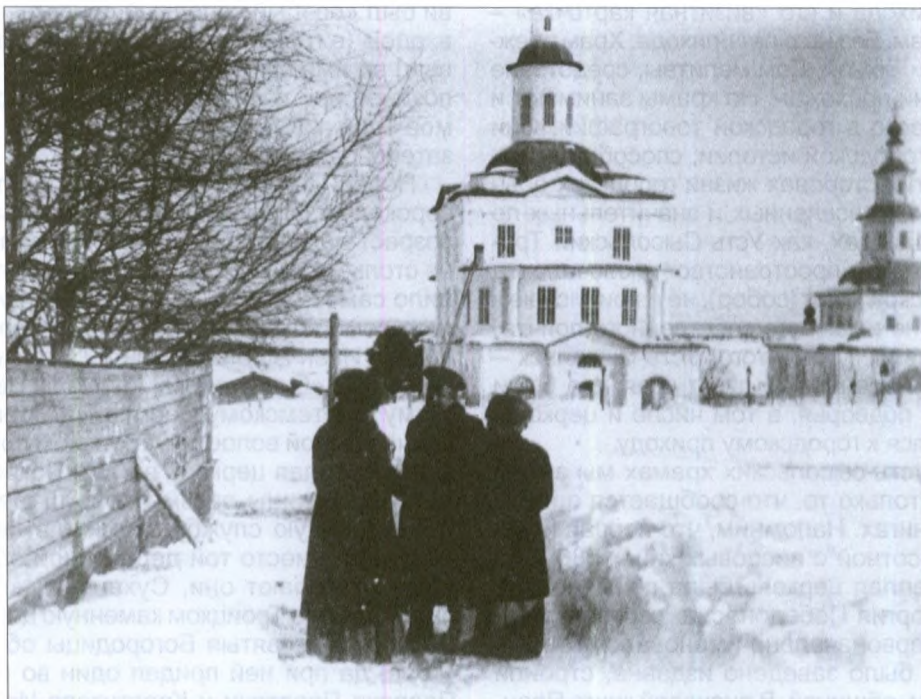
Троицкий собор зимой