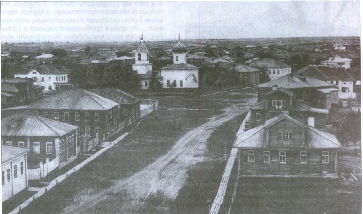
Троицкая улица и Стефановская церковь подворья Ульяновского Троице-Стефановского монастыря