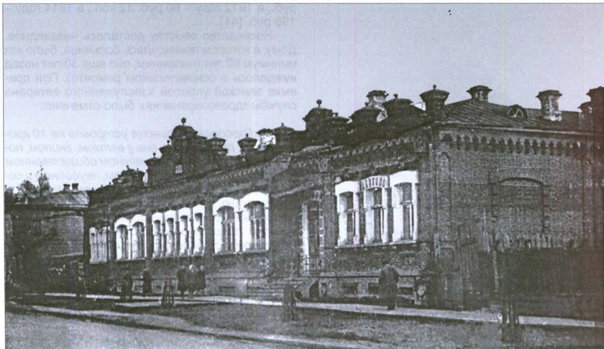
Земская больница. Снимок 1948 г.

Штат больницы, как явствует из росписи расходов на ее содержание, состоял, кроме лекаря, получавшего государево жалованье, из смотрителя, прачки (она же, вероятно, и кухарка) и сторожа. Кроме того, с некоторой натяжкой к медицинским работникам можно отнести оспопрививателя и повитуху (начиная с 40-х годов XIX века ей оплачивался «наем квартиры», которая, надо полагать, и служила акушерским пунктом). Получалось, что обслуживающего персонала было больше, чем больных. В 1855 году эта «несправедливость» была исправлена – больницу расширили до 10 коек, втиснув их в то же здание. Понятно, что единственный штатный врач был не особенно загружен работой в больнице и большую часть времени тратил на частные визиты, обслуживая городскую верхушку.