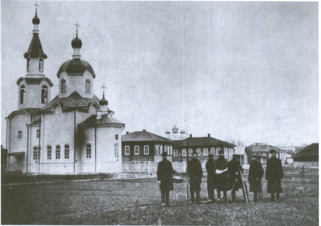
Богородицкая тюремная церковь

свода первого этажа. И после этого дело встало – закончились и материалы, и деньги. В отчете комиссии за 1860 год отмечено, что строительные работы уже не велись, рабочие занимались починкой сараев, печей и т.д.