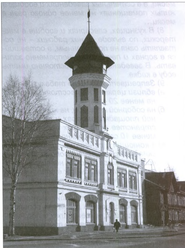
Пожарная каланча. Современный вид

Усть-Сысольская городская дума ограничилась двумя обязательными постановлениями, принятыми в 1881 году, – «по предметам городского благоустройства» (о нем речь пойдет ниже) и «касательно мер предосторожности от пожаров». Эти документы прошли придирчивую проверку в губернском по городским делам присутствии и были утверждены губернатором только после неоднократных доработок. Правила противопожарной безопасности были согласованы с «временными правилами по предметам городс-