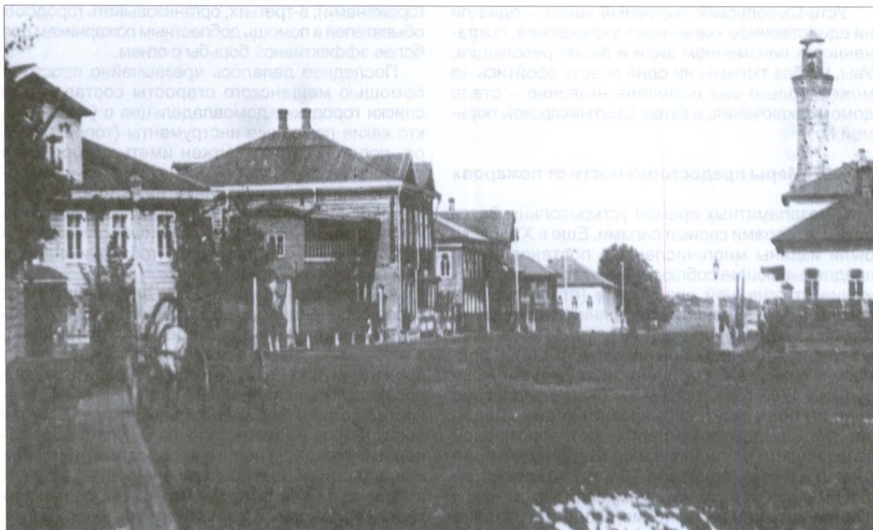
Спаская улица. Справа – пожарная каланча

ствующими к оному предметами» обошлась городу в 803 руб. 82 коп. (более половины этой суммы «съела» новая пожарная труба, а почти весь остаток – наем лошадей).