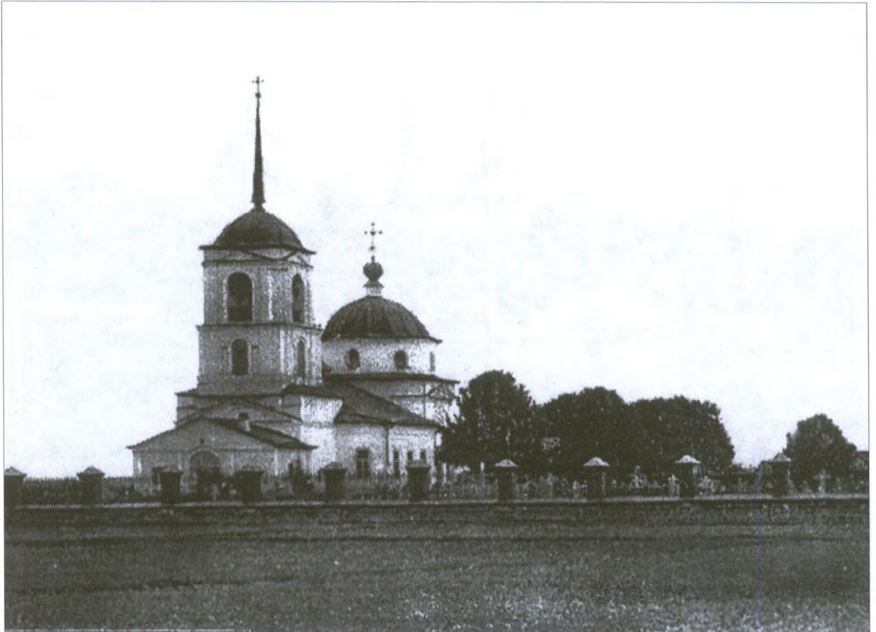
Вознесенская кладбищенская церковь